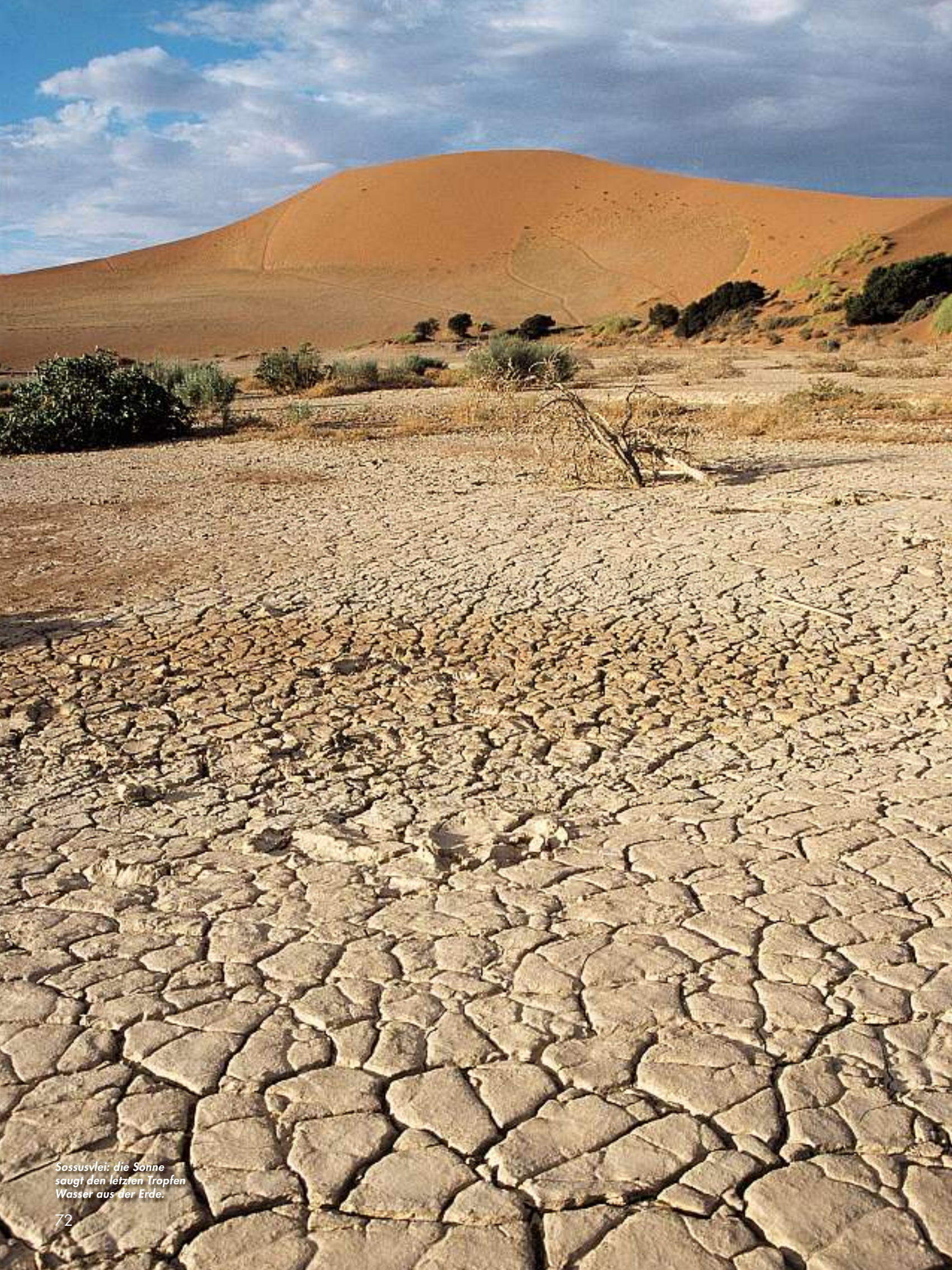
Sossusvlei: die Sonne saugt den letzten Tropfen Wasser aus der Erde.