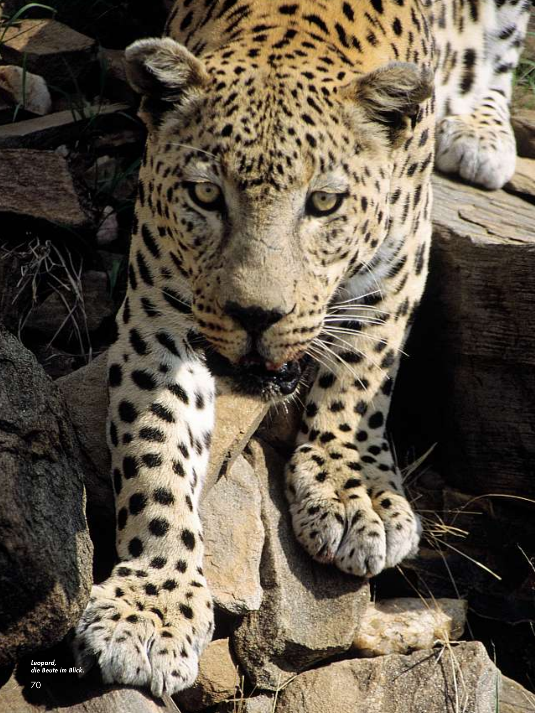
Leopard, die Beute im Blick.