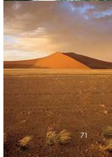
Von oben nach unten: Aloe, der Koeberbaum Elefanten beim «Fingerhakeln» Sandberge in der Namib Leopard als Baumkletterer Dünenlandschaft der Namib