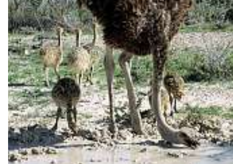
Von oben nach unten: Straussenfamilie, Lektion im Wasser trinken Gelbschnabel-Toko «Donkey-Car» im Damaraland Abu Huab bei Hochwasser Chamäleon Abendstimmung bei der Palmwag Lodge

Dieses Jahr sind die grossen Regenfälle im Januar und Februar ausgeblieben, und die Pfanne liegt trocken unter blauem Himmel. Jenseits der weissen Seefläche verschwimmt der Horizont wie bei einem Aquarell. Dunkle Gestalten schweben über dem Weiss. Im gleisendem Licht zittern und verzerren sich ihre Umrisse wie tanzende Spukgestalten. Sie nähern sich und werden grösser, bis sie endlich klare Formen annehmen und ich sie als Zebras identifizieren kann. Der Anblick der Tiere versetzt mich in eine Zeit zurück, als der Mensch noch unbedeutend war und die wilde Natur die Erde dominierte.