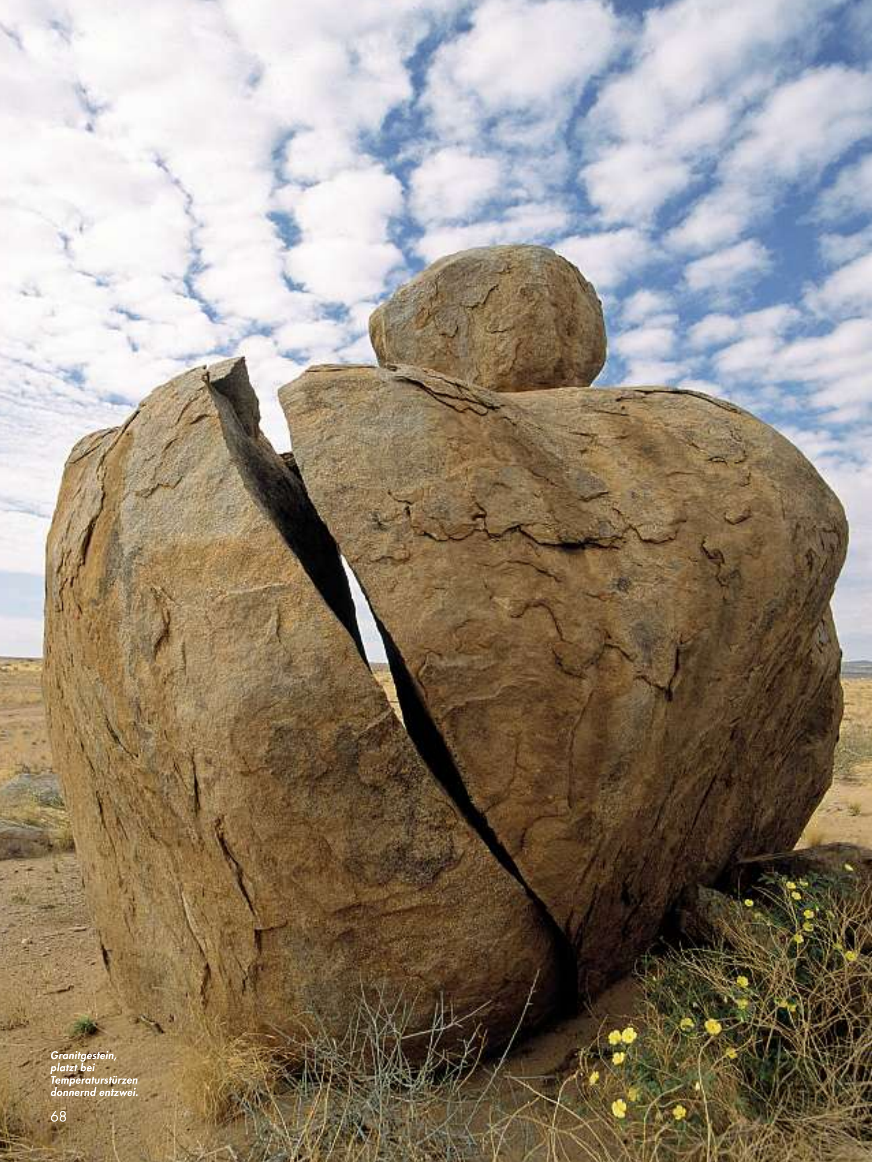
Granitgestein, platzt bei Temperaturstürzen donnernd entzwei.