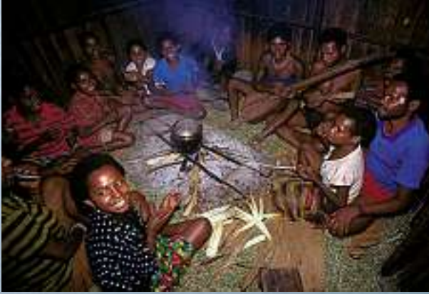
Fröhliche Partnersuche am Feuer: Singend und klatschend machen sich unverheiratete Männer und Frauen über das Feuer hinweg mit den Händen Zeichen, um ihre gegenseitige Sympathie auszudrücken.