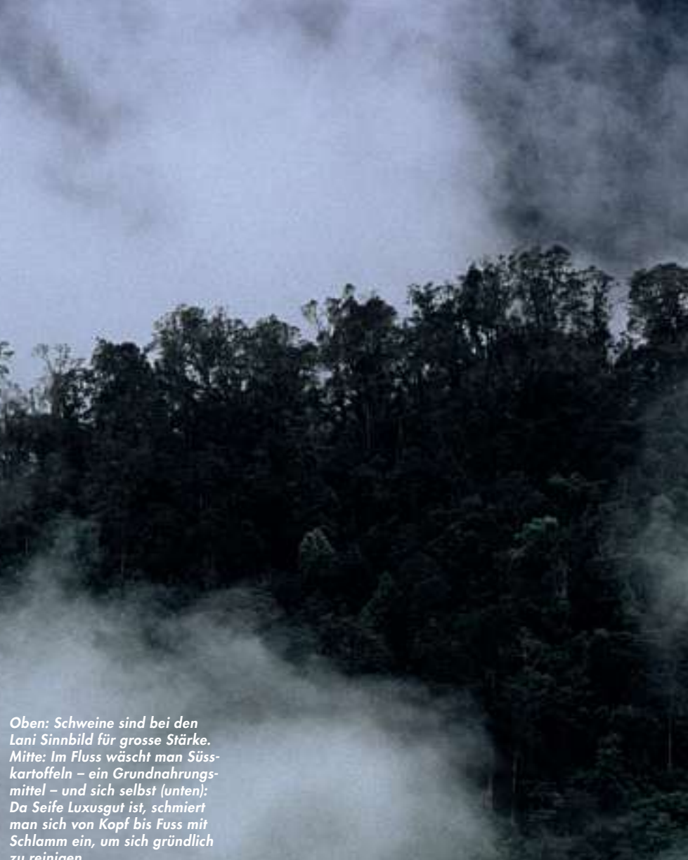
Oben: Schweine sind bei den Lani Sinnbild für grosse Stärke. Mitte: Im Fluss wäscht man Süsskartoffeln – ein Grundnahrungsmittel – und sich selbst (unten): Da Seife Luxusgut ist, schmiert man sich von Kopf bis Fuss mit Schlamm ein, um sich gründlich zu reinigen.