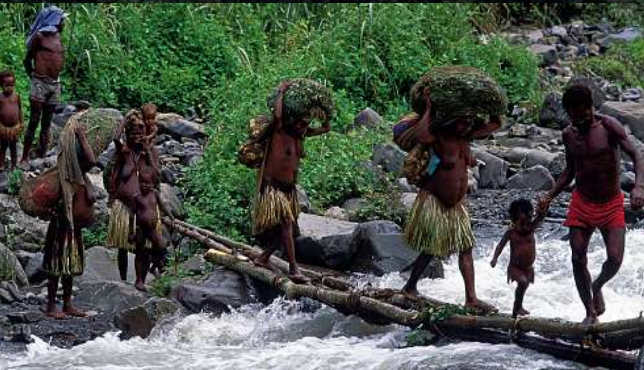
Über wackelige Holzbrücken oder Baumstammstege führt der Weg von Dorf zu Dorf. Die traditionellen Röcke der Frauen aus Gras oder Rotangeflecht sieht man nur noch selten, sie wurden vielerorts durch Textilien abgelöst.