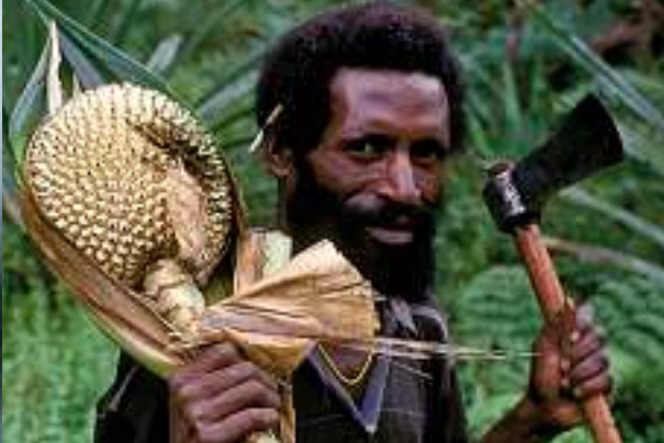
Alltag beim Volk der Lani: Arbeit auf den terrassierten Feldern und buntes Markttreiben. Die tiefrote Frucht «Buch merah» (rechts) wird zu einer dickflüssigen Sauce verarbeitet, die man gesalzen zu Gemüse und Kartoffeln isst.