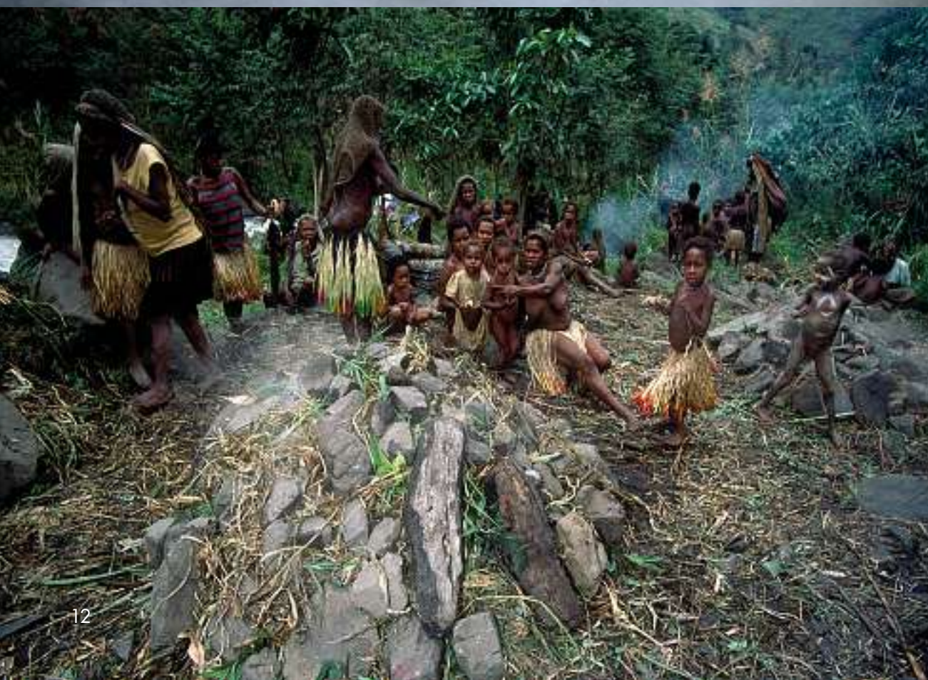
Traditionelles Lani-Fest: Um böse Geister zu besänftigen, wird ein Schwein geschlachtet. Ein Haufen Holz und Steine werden in Brand gesteckt. Später werden unter den heissen Steinen in einer Grube Kartoffeln und das Schweinefleisch gegart.