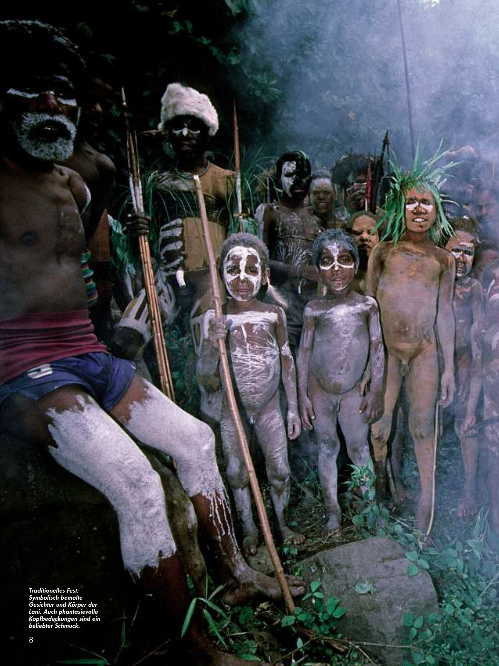
Traditionelles Fest: Symbolisch bemalte Gesichter und Körper der Lani. Auch phantasievolle Kopfbedeckungen sind ein beliebter Schmuck.