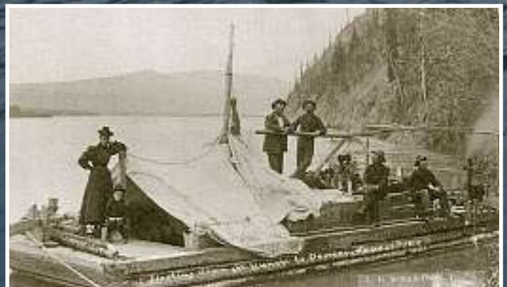
Die Bilder gleichen sich: Goldsucher auf demselben Fluss vor 110 Jahren.