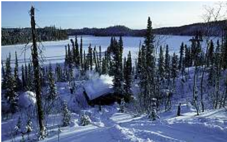
Märchenhafter Winterzauber bei der «rauchenden» Blockhütte über dem See.