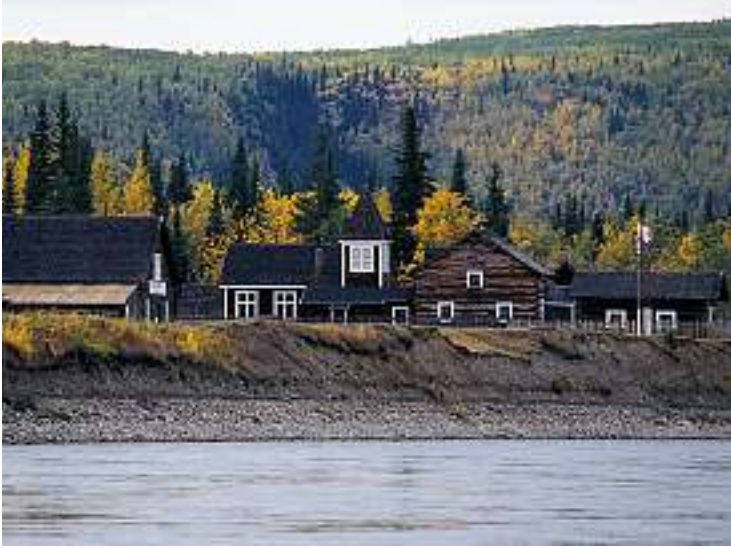
Zur Goldrausch-Zeit blühte Fort Selkirk als Handelsposten auf.