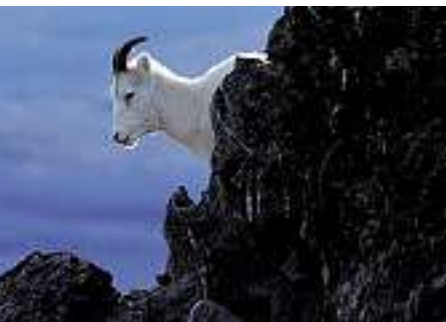
Bootsfahrt auf dem Lake Laberge. Gelegentlich wird ein Schwarzbär oder ein Dallschaf gesichtet.

Hier hatten die Goldsuchenden den ganzen Wald gefällt und Boote gezimmert. Am 29. Mai 1898, nach dem Aufbrechen des Eises, startete in Bennett innerhalb von 48 Stunden eine Flotte von 7200 Booten in Richtung Klondike! Heute zeugt nur noch der Bahnhof sowie die 1899 erbaute St. Andrew's Presbyterian Church von der ehemaligen Stadt mit 5000 Einwohnern. Auch der Wald ist wieder nachgewachsen.