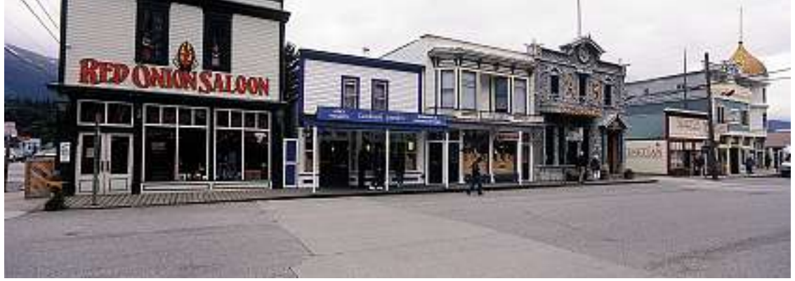
Skagway war während des Goldrauschs von 1898 für die Goldgräber wichtiger Stütz- und Ausgangspunkt.

Von hier, auf Meereshöhe, startet man zum 1140 Meter hohen Chilkoot Pass. Der Chilkoot ist einer der wenigen gletscherfreien Korridore über das bis zu 6000 Meter hohe Küstengebirge. Über 100'000 Goldsucher überquerten diesen Pass zwischen 1897 und 1899. An der kanadischen Grenze auf der Höhe des Passes mussten die Glücksritter Ausrüstung und Proviant für ein Jahr vorweisen können, um passieren zu dürfen. So versuchte Kanada eine Hungersnot in Dawson City zu vermeiden. Mindestanforderung an Lebensmitteln war: 500 Pfund Mehl, 100 Pfund Zucker sowie diverse andere Lebens- und Gebrauchsmittel wie z.B. 500 Kerzen. Das Gewicht der erforderlichen Ausrüstung, das in mehreren Etappen über den Pass transportiert werden musste, belief sich auf fast 1000 Kilogramm. Um die komplette Ausrüstung über die