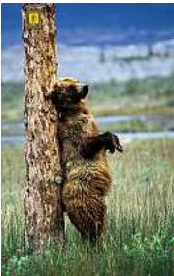
Bürige Pause am Wanderweg.

Noch bevor die Expedition Alsek abgeschlossen ist, keimt