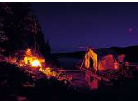
Ein echter Abenteurer lässt sich den Fahrtwind um die Nase wehen. Nachts am Lagerfeuer wird fein gekocht und geschlemmt.

Zurück in der Zivilisation, wollen wir die Vorzüge auch nutzen und eine warme Dusche geniessen. In der Dusche des Hotels werde ich aber wieder mit den Tücken der Technik konfrontiert. Bis ich endlich herausgefunden habe, wie das warme Wasser funktioniert, ist mein Geld für den Münzautomaten aufgebraucht. Ein kaltes Bad hätte ich auch im Yukon nehmen können.