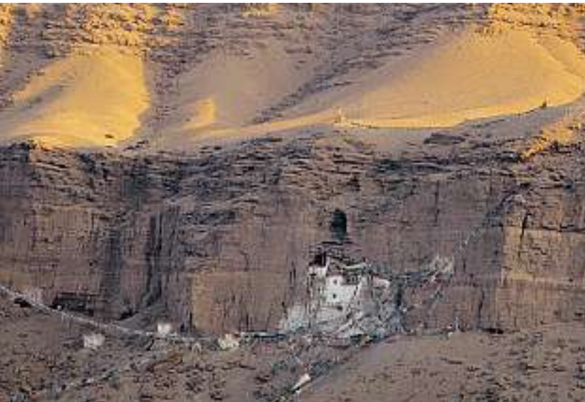
... im Höhlenkloster bei Gurugyam im Garuda-Tal.

Befunde gibt? Wir konnten nichts weiter tun als die oberflächlich vorhandenen Zeugnisse der Vergangenheit zu dokumentieren, in der Hoffnung, die Aufmerksamkeit der Fachwelt auf diese versunkene Kultur zu lenken, die den Schlüssel für die vorbuddhistische Geschichte Tibets bildet.