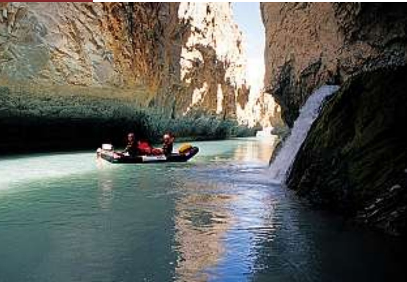
Paradiesische Ambiance: Vielfalt an Formen, Farben, Wasserfällen.

noch für einen Generalangriff auf den Gaumen, muss aber anerkennen, dass sich der Geschmack indessen deutlich verbessert hat. In jedem Fall liefert sie Kalorien und diese haben wir auf den nächsten Passagen dringend nötig.