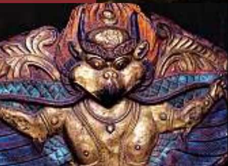
Khyung oder Garuda

Aus einer Bön-Schrift des 13. Jahrhunderts