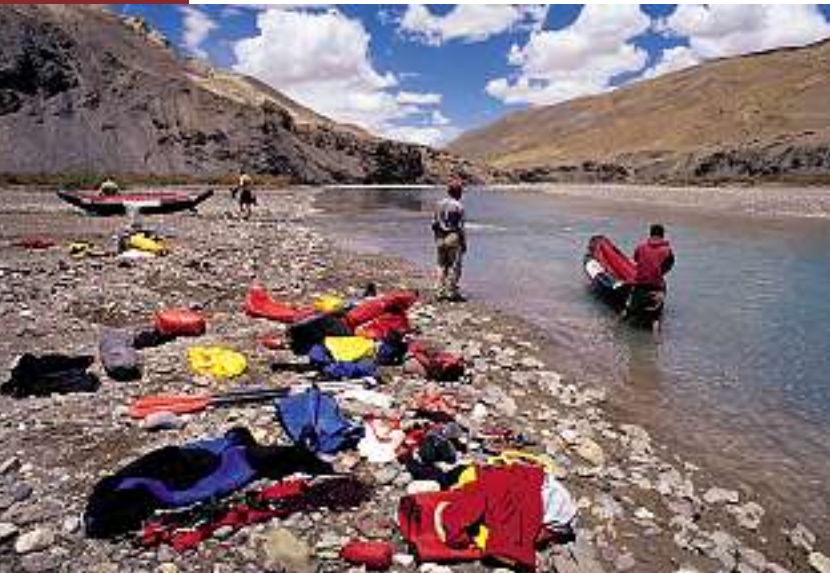
Am Ziel: Ausbootstelle nach der Erstbefahrung des Sutley Canyon.

reicht haben. Abermals erfolgt die Metamorphose vom Paddler zum Bergsteiger. Im Gegensatz zu vorhin stehen wir keiner geschlossenen Felswand gegenüber, sondern einer zwar steilen, aber begehbaren Bergflanke.