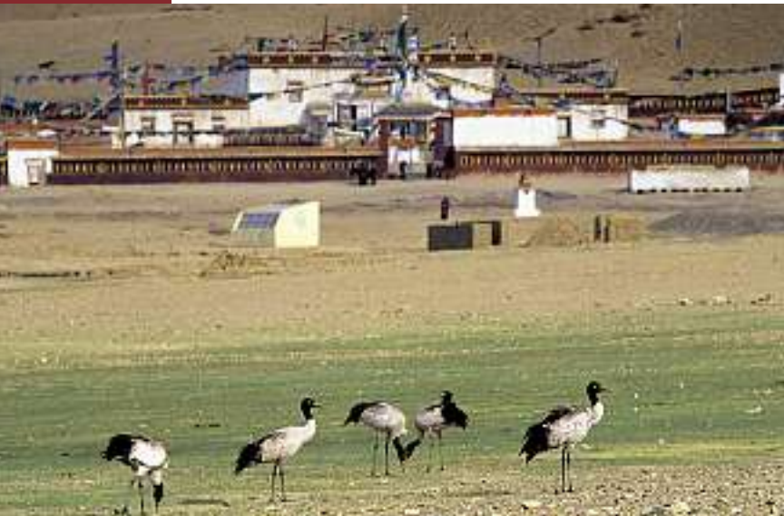
Schwarzhalskraniche vor dem Bön-Kloster Gurugyam.