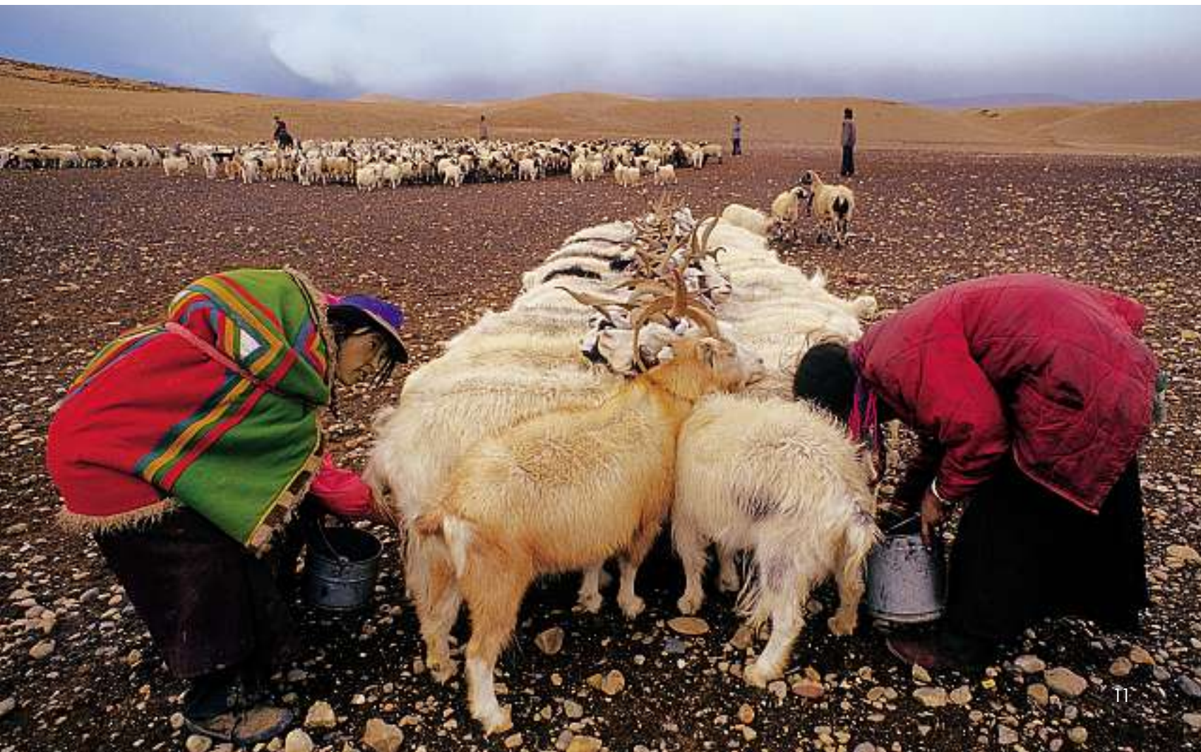
Nomadenfrauen beim Ziegen melken.

Eigentlich begann diese Reise sogar noch früher, nämlich mit der Lektüre eines Romans. Ein Brite namens James Hilton hatte 1934, mitten in der Zwischen-