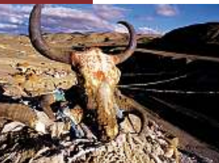
Der Pilgerort Tithapuri.

War das alles nur Legende? Lässt sich die Existenz eines solchen Reiches leugnen, bloss weil es noch keine archäologischen