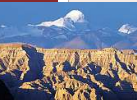
Sutley Canyon, im Hintergrund der Himalaya.