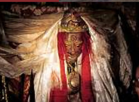
Bön-Gottheit des Kailash