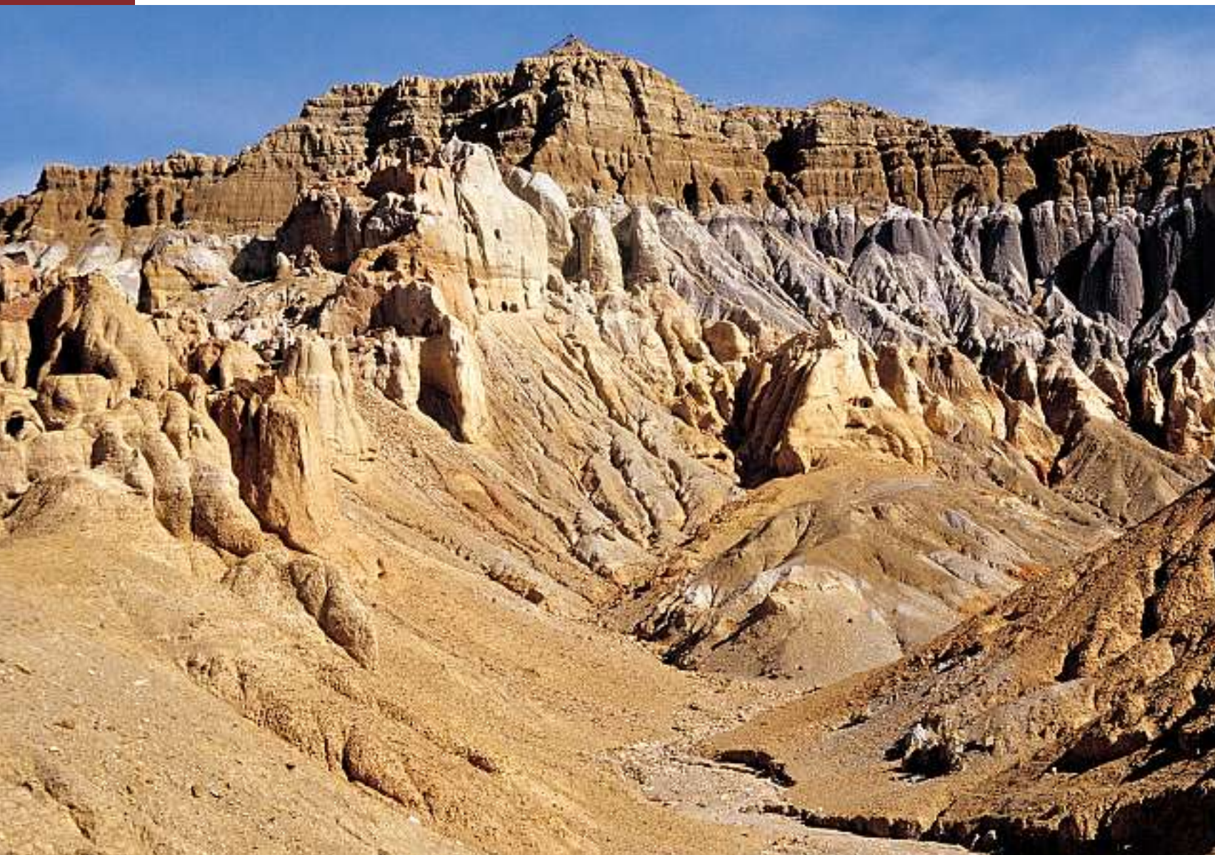
Gesamtansicht des Khyunglung Ngulkar Karpo, des «Silberschlosses» aus der Zeit des vorbuddhistischen Königreichs Shang Shung im Garuda-Tal.

kriegszeit, als die Menschen im Westen mehr denn je eine Projektionsfläche für ihre Wünsche und Sehnsüchte brauchten, ohne selbst je in Tibet gewesen zu sein, ein Buch mit dem Titel «Verlorener Horizont» verfasst, das schnell zum Weltbestseller wurde. Dabei beschrieb er einen paradiesisch anmutenden Ort irgendwo in Tibet, den er Shangri-La nannte. Dorthin hatte es eine Handvoll Briten und Amerikaner auf abenteuerliche Weise verschlagen, die sich zunächst gegen den Zwangsaufenthalt sträubten, aber nach und nach dem Zauber erlagen, der diesem Ort inne wohnte.