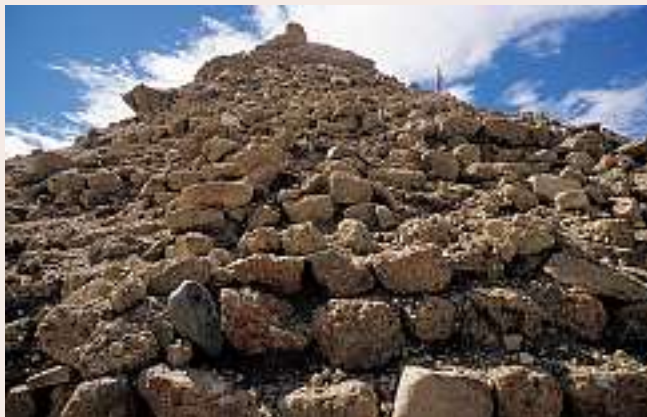
Die Shang Shung-Festung Khardung

Die Geschichte Shang Shungs ist noch nicht geschrieben. Wir wissen nichts über die Anfänge dieses Reiches, nur wenig über das Leben in dieser Epoche Tibets, aber wir wissen gut Bescheid über die letzten Tage Shang Shungs und zwar dank einer einzigen Schrift, die mehr als 2000 Kilometer entfernt in der berühmten Höhlenanlage von Dunhuang an der Seidenstrasse gefunden wurde. Dort haben europäische Forscher zu Beginn des letzten Jahrhunderts eine ganze Bibliothek mit alten