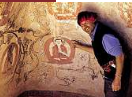
Buddhistische Höhlenbilder im Silberschloss.

In deren Nähe fand sich auch noch ein Bön-Kloster. Einer der Mönche zeigte mir einen alten Blockdruck, auf dem ich ein Abbild des buddhistischen Paradieses Shambhala zu erkennen glaubte. Doch der Mönch belehrte mich, dass das Bild nicht Shambhala zeige, sondern das Bön-Paradies, das er Olmolungring nannte. Anders als das buddhistische Paradies zeigte das der Bön-Religion klare geographische Konturen. Im Mittel-