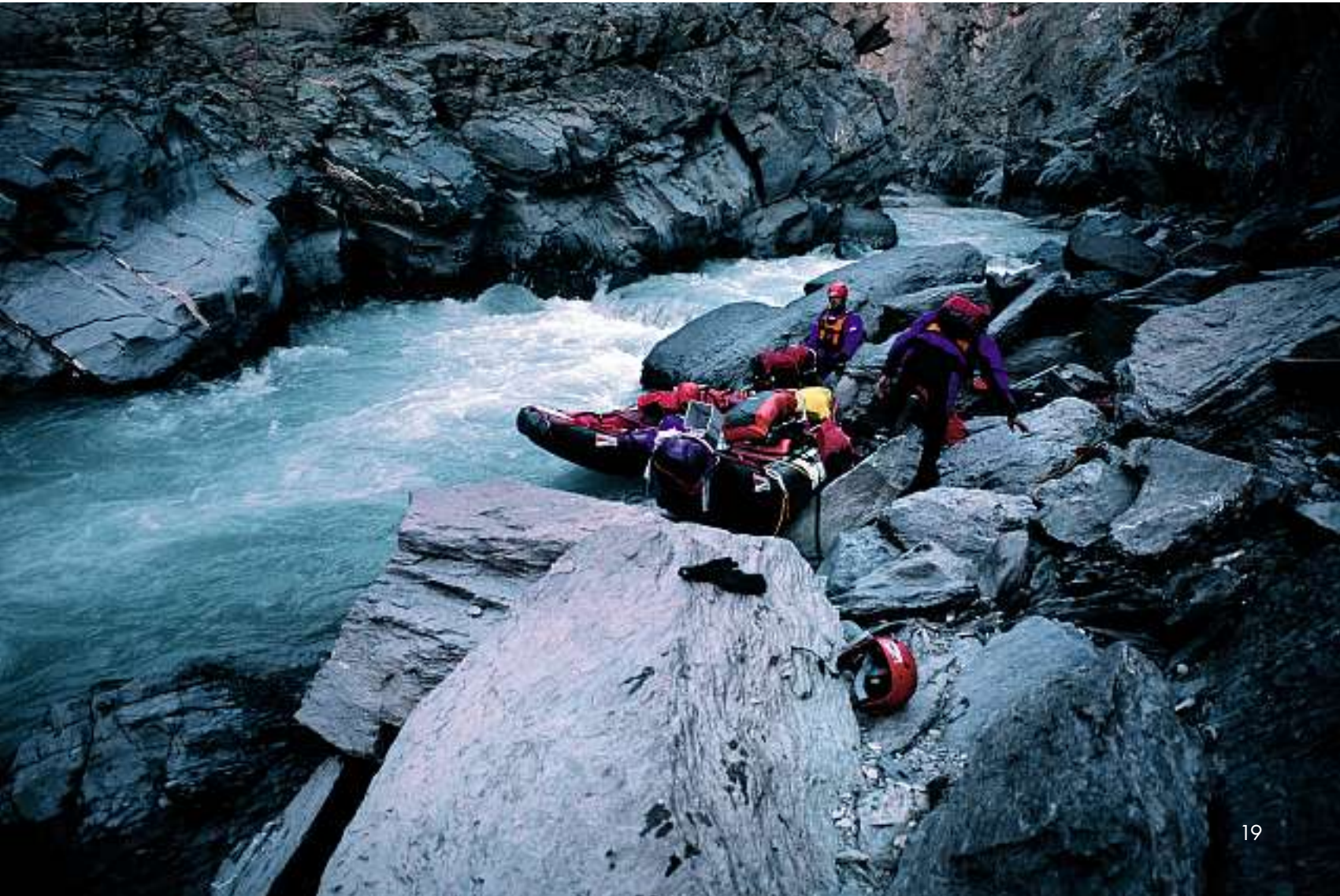
Wir passieren eine Engstelle bei Khyunglung (Garuda-Tal).

Am anderen Ufer ziehen wir dann das Boot im Wasser wattend flussaufwärts, bis wir eine gute Stelle zum Ausstieg er-