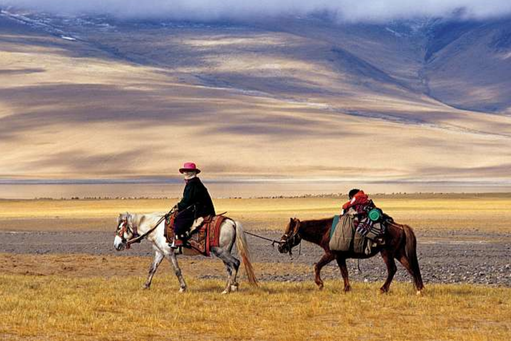
Nomadefrau mit Kind auf Wanderschaft im Garuda-Tal.

die belegen, dass diese heute so öde Gegend einstmals ein blühendes Kulturzentrum war.