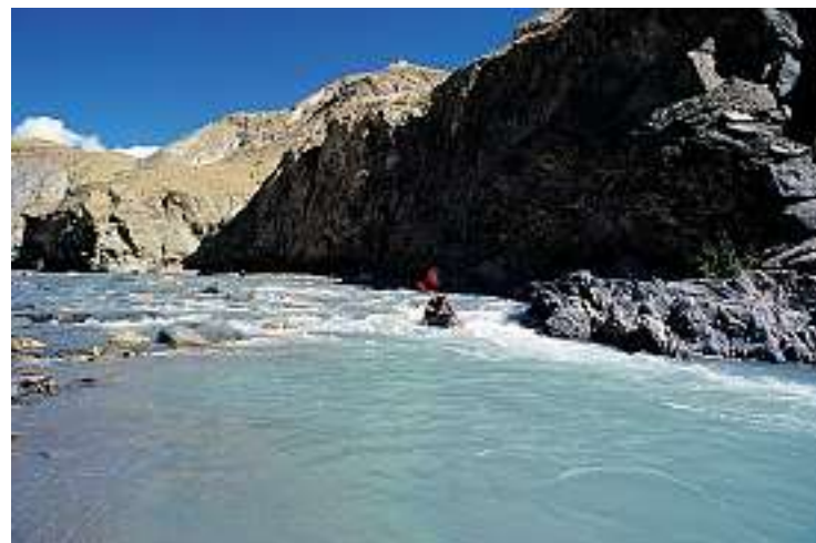
Einfahrt in den Sutley Canyon.