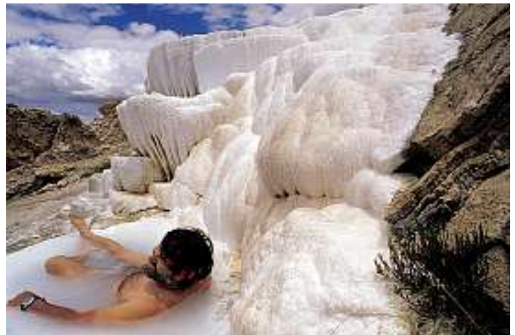
Himalaya-Wellness: Sinterterrassen und Thermalpools mit Sicht aufs Silberschloss.

punkt von Olmolungring war der Berg Tise eingezeichnet an dem vier grosse Flüsse ihren Anfang nahmen. Tise ist aber nichts anderes als der alttibetische Name für den Kailash, und die vier Flüsse sind Indus, Brahmaputra, Sutley und Karnali, die dort ihren Ursprung haben.