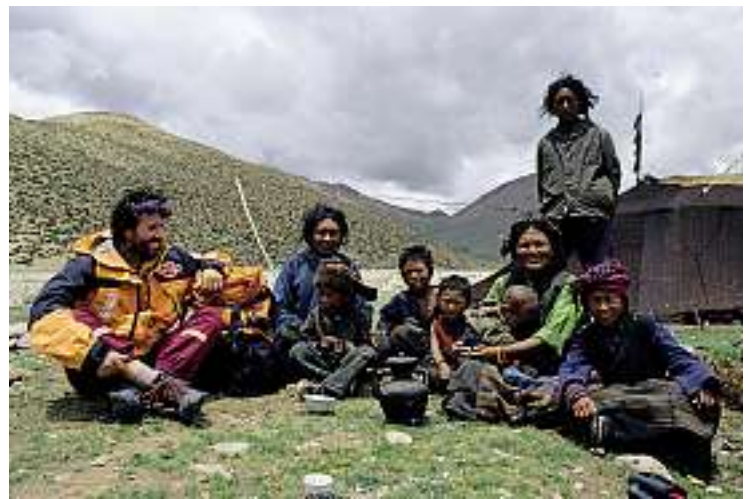
Begegnung mit Nomaden bei der Transhimalaya-Überquerung.

Das Besondere ist aber die Farbe. Die Felsen glänzen als wären sie mit purem Silber überzogen. Nirgendwo sonst hatte