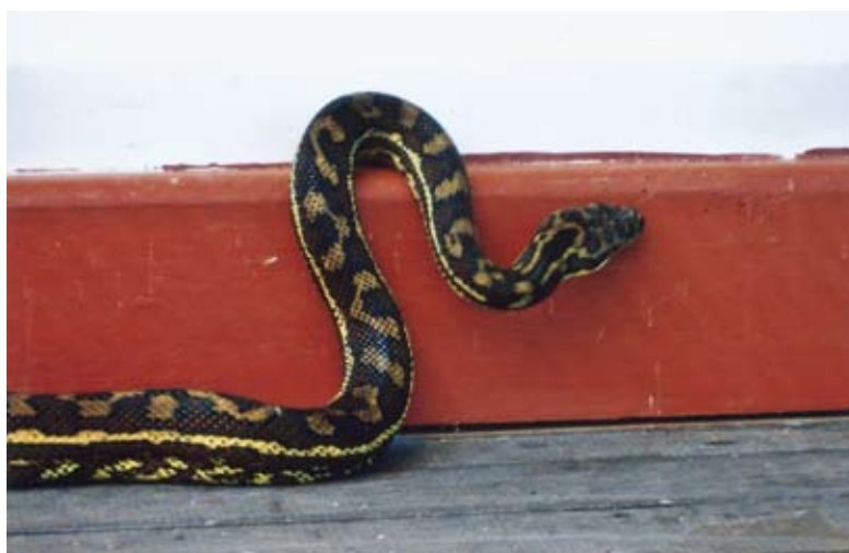
Haustier Diese harmlose Pythonschlange machte es sich regelmässig auf dem Balkon bequem.