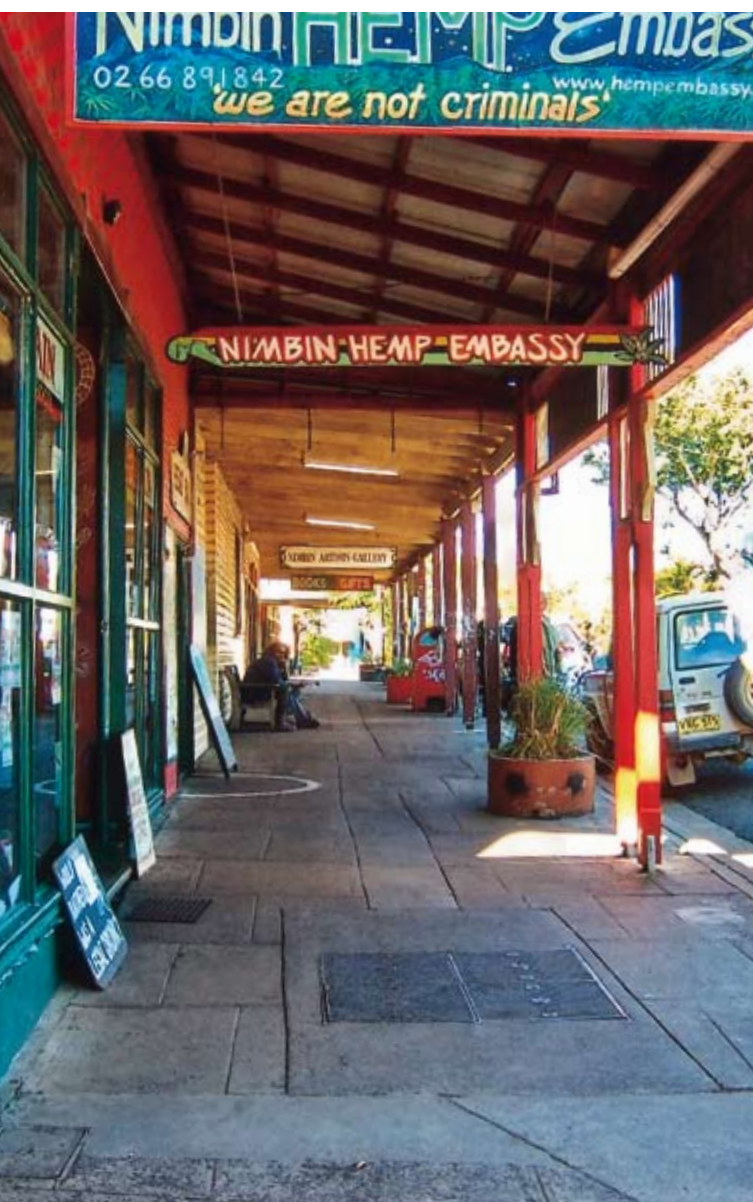
Nimbin Im kleinen Städtchen in New South Wales hat die Hippie- und Hanfkultur der 70er-Jahre überlebt. Es gibt sogar eine Hanfbotschaft.

erwarten, dafür aber nur einen 2-Sterne-Preis bezahlen wollten. Trotz grosszügigem Rabatt reisten sie vorzeitig ab und vergassen zu allem Übel einige Kleider im «scheusslichen Kleiderschrank mit nicht zusammenpassenden Kleiderbügeln». Nachdem ich ihnen einen ganzen Tag lang hinterhertelefoniert hatte, holten sie die Kleider endlich ab und belohnten unsere Bemühungen mit einer guten Flasche Wein und einer Einladung nach Sydney.