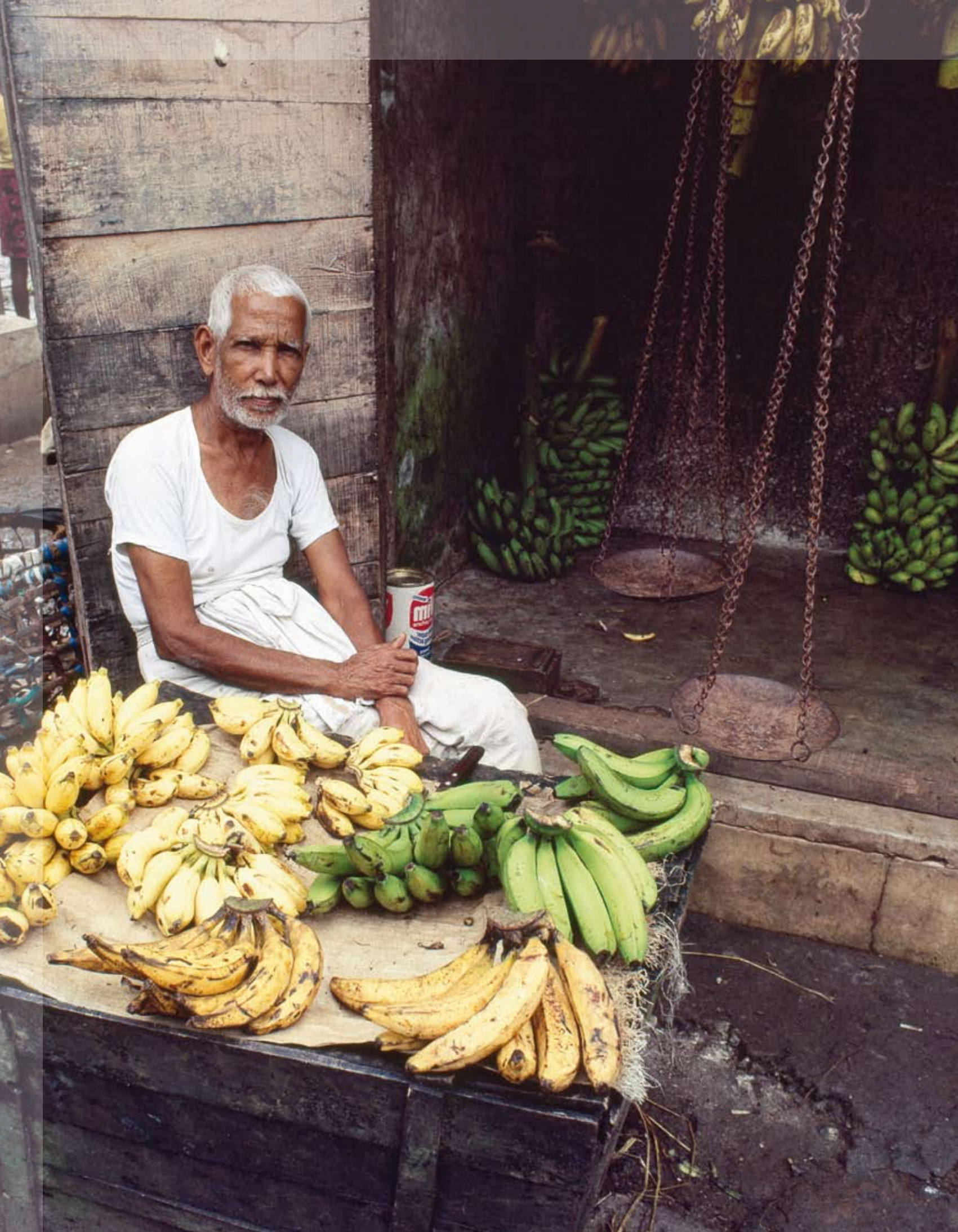
Bananenvielfalt Dick und grün zum Kochen oder klein und süß zum sofort Geniessen.