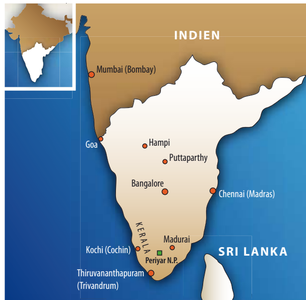
Südliches Indien Abwechslungsreiche Landschaften und faszinierende alte Kulturen zwischen Goa und Kerala.

Nach der Ankunft gehe ich direkt zum Ashram, wo ich mich einquartieren möchte, da hier die Übernachtung und Verpflegung fast nichts kosten. Umgeben von einer mächtigen, rosa getünchten Mauer ist das Gebäude nicht zu übersehen. Ich will hinein, werde aber sogleich von einem Pförtner aufgehalten. «Sai Ram is not here, I don't know when he is coming.» «I know. Can I stay here?» «Where are you from?» «Switzerland.» «What are you doing in India?» «Travelling.» «Alone?» «Yes.» «You can't stay here when Sai Baba is not here.» «Why?» «You can not stay here. Come back when he is back.» «Why?» «No.» Die Diskussion erliegt einem schnellen Ende. Wann er denn zu kommen gedenke? «Only Baba knows, maybe tomorrow, maybe the day after tomorrow.» Ich habe ver-