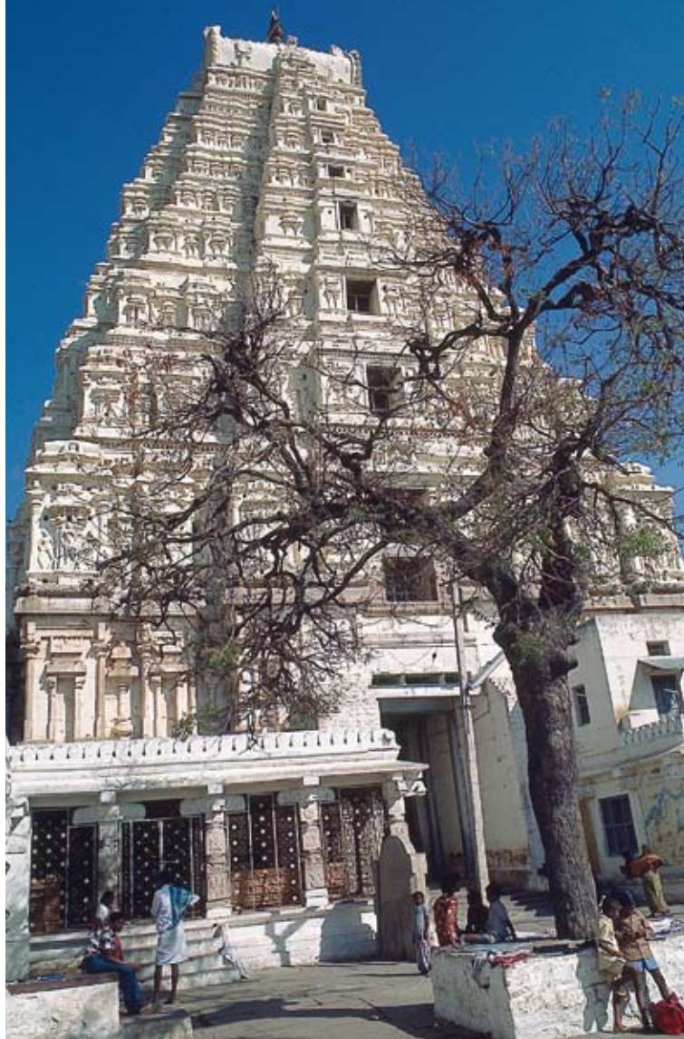
Virupaksha-Tempel in Hampi Der im 7. Jh. als kleiner Schrein begründete Tempel ist Shiva gewidmet (hier auch Virupaksha) und wurde im Laufe der Zeit zu einem kunstvollen und erhabenen Tempel ausgebaut.

Geschenkte Tage in Hampi Der eine Tag ist genug, ich werde unruhig, die Menschen hier machen mich konfus. Am nächsten Tag treibt es mich weiter, nach Hampi, der Stadt des Sieges. Vor vier- bis fünfhundert Jahren wurden all die tausend Tempel von einem herrschsüchtigen Mogulherrscher und dessen Gefolge geplündert und zerstört. Dennoch ist der Ort von einer mächtigen Ausstrahlung beseelt. Trotz der grossen Zerstörung liegt noch immer ein Hauch alter Zeiten über allem. Die verschwenderische