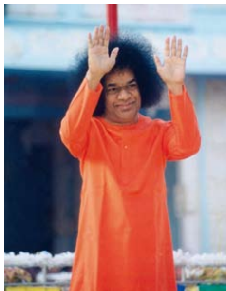
Sai Baba Sai Baba gehört weder einer Religion an, noch verkündet er eine solche. Seine Mission – in Anerkennung anderer Lehren und Traditionen – geht über die Religionen hinaus.