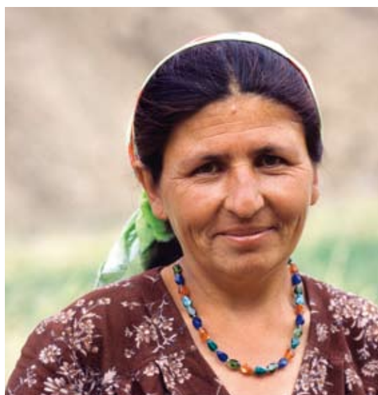
Würdevolle Mädchen. Scheu und stolz. Das Lieblingsbild des Autors.