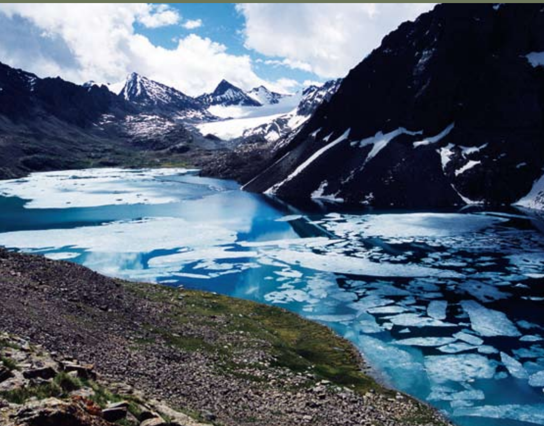
Eis im Sommer. Gefrorener Bergsee im Terskey Alatau Gebirge in Kirgisistan.

bringt. Gibt es nicht eine einfachere Art, Kirgisistan zu bereisen? Wieso steuern wir immer wieder scheinbar unerreichbare Orte an?