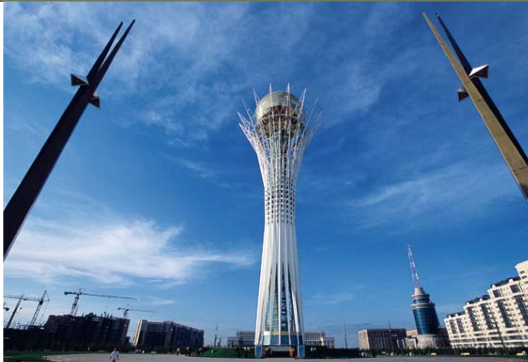
Bauboom. In Kasachstans neuer Hauptstadt Astana wird auch extravagant gebaut.

Wir hatten nur vage Vorstellungen, was uns erwarten würde. Kein einziger Bildband von Zentralasien war aufzutreiben, und die Reiseführer über dieses riesige Gebiet konnten wir an einer Hand abzählen. Warum war das so? Wieso schien sich niemand für das Herz Asiens zu interessieren? Wir wollten der Sache auf den Grund gehen. Trotz den spärlichen Informationen fan-