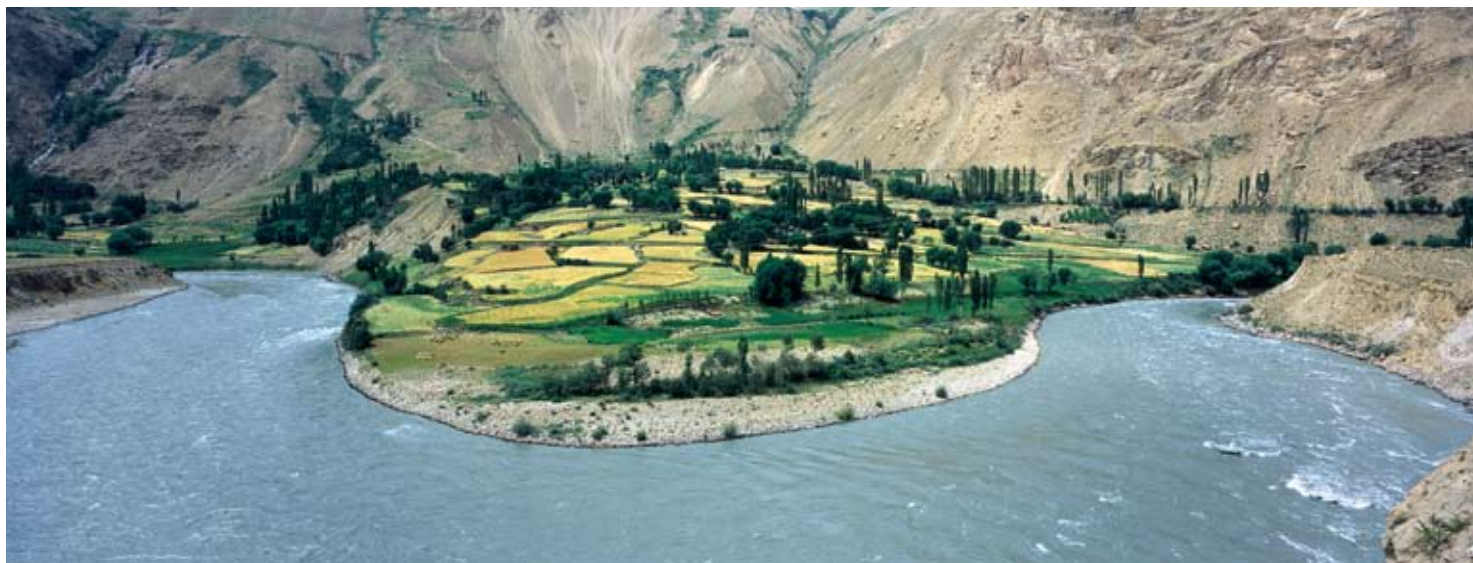
Grünes Wakhan-Tal. Blick von Tadschikistan über den wilden Pani-Fluss nach Afghanistan.

Wir müssen zwei-, dreimal «Hallo, Hallo!» rufen, bis wir am Schlagbaum bemerkt werden. Es sind gewiss nicht viele Velofahrer unterwegs, und unser unverhofftes Auftauchen scheint den verschlafenen wirkenden Soldaten etwas zu irritieren. An unseren Papieren hat er keinerlei Interesse, viel lieber möchte er eine Runde mit meinem Fahrrad drehen. Das erlaube ich ihm gerne, weiss aber genau, dass er an dem schweren Drahtesel und dem für ihn viel zu hohen Sattel keine Freude finden wird. Nach zwei, drei ver-