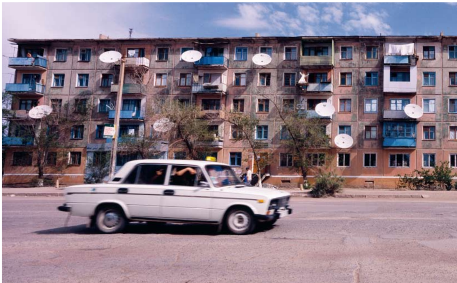
Aus alten Sowjetzeiten. In vielen Städten Zentralasiens stehen solch typische Plattenbauten.

maligen Seidenstrasse versetzt wird. Unsere Velos sollten uns über den Tien Shan, das Himmlische Gebirge, dann über den Pamir, das Dach der Welt, mit der höchstgelegenen Gebirgsstrasse der Erde bis zum Fuss des Hindukusch und weiter ans Ziel unserer Reise, nach Usbekistan, tragen.