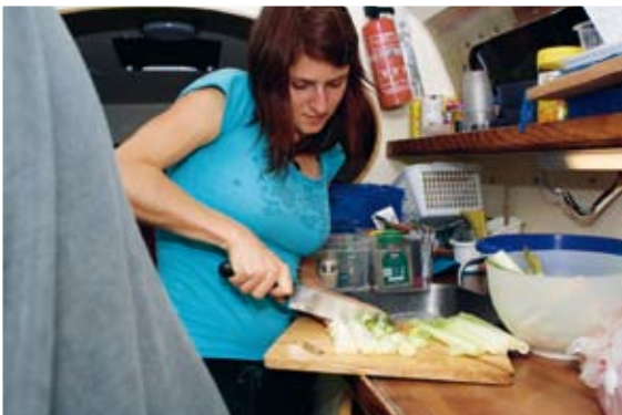
Bordleben. Eine gefangene Goldmakrele bereichert den Speisezettel. Gemeinsames Anpacken bei Segelwechsel. Trotz enger Bordküche kommt frisches Gemüse auf den Teller.