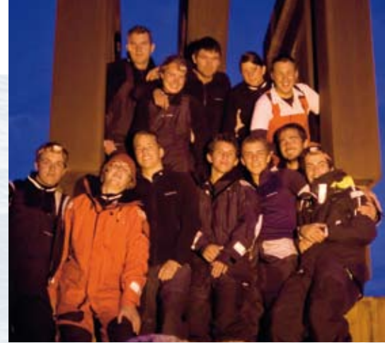
Glückliche Ankunft. Nach 22 Tagen auf See können sich die Crews der beiden Boote in Goudeloupe wieder in die Arme schliessen.