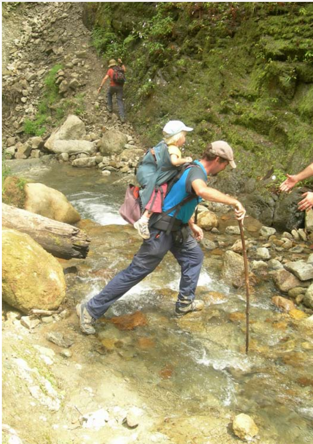
Zu Fuss unterwegs. Ein Trekking in Tana Toraja führt durch unwegsames Gelände.

Wir sind um 6.30 Uhr aufgestanden, damit wir wie abgemacht um 8.30 Uhr bereit sind, aber der Bus nach Baruppu fährt dann doch erst um 10.30 Uhr. Wenn wir hier etwas lernen können, dann ist es Geduld. Die Wartezeit vertreiben sich die Einheimischen mit Essen, Rauchen, Fingernägelschneiden, Schlafen und Schwatzen. Der Bus, der schliesslich vor uns hält, sieht aus, als wäre er einmal ausgebrannt. Wir sind 17 Personen auf den zehn Sitzen, dazu liegen Kisten und Bündel auf dem Boden verteilt. Auf dem Dach werden mit Schnüren weitere Taschen und unsere Rucksäcke festgezurrert. Die Strasse ist schlecht befestigt und holperig und führt oft ungemütlich nahe an tiefen Abgründen entlang.