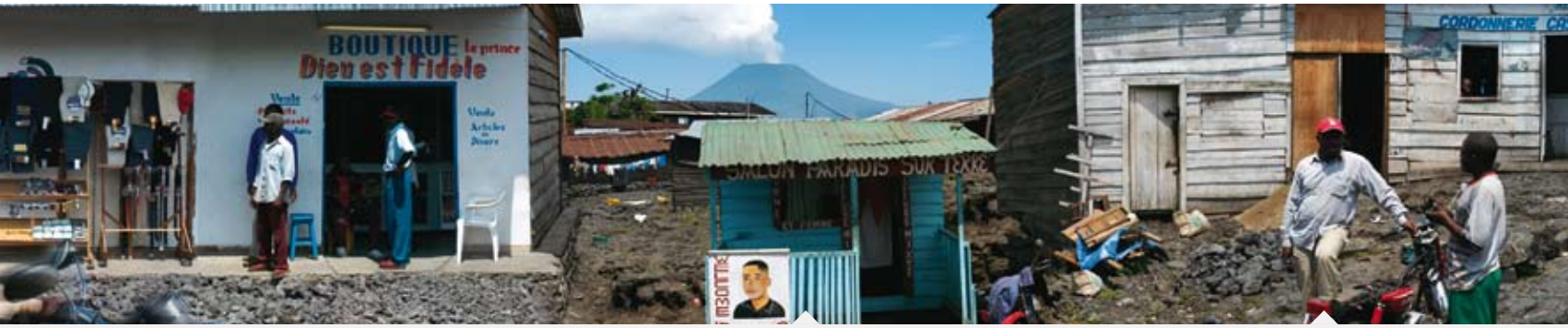
Der 3470 m hohe Vulkan Nyiragongo. Am 17. Januar 2002 brach er wieder einmal aus. Ein Lavaström zerstörte mehrere Dörfer und ein Lavaström floss durch die Stadt in den Kivusee.