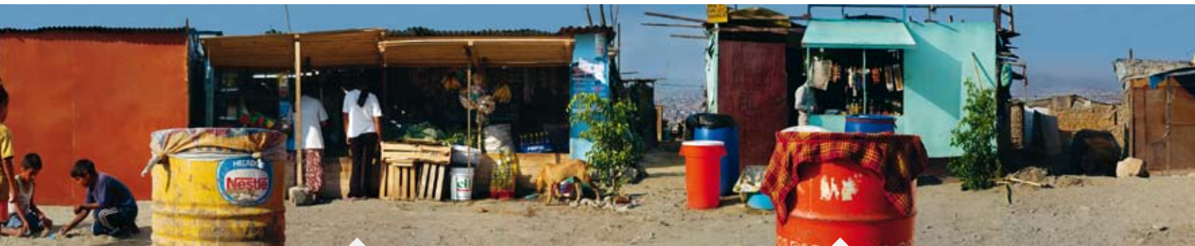
Lisi (22) ist seit drei Monaten Witwe. Sie und ihr Mann führten eine Imbiss-Bude. Ihre Verwandten sind alle im Amazonasgebiet. Sie sucht Arbeit, um den Sohn durchzubringen.