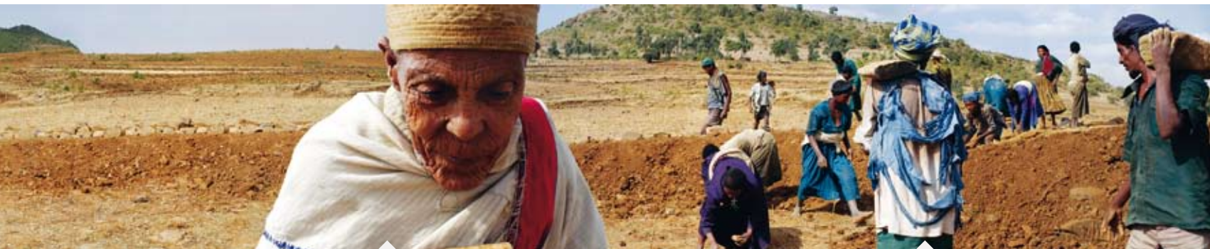
Findoku weiss nicht, wie alt sie ist. Sie hat gerade eines ihrer acht Kinder besucht. Jeden Mittwoch und Freitag fastet Findoku. An diesen zwei Tagen isst sie keine tierischen Produkte, nur Injera (Getreidefladen), Bohnen und Gemüse.