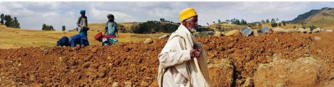
Zeuude ist auf dem Weg zu seinem kranken Bruder im 17 km entfernten Debre Tabor.