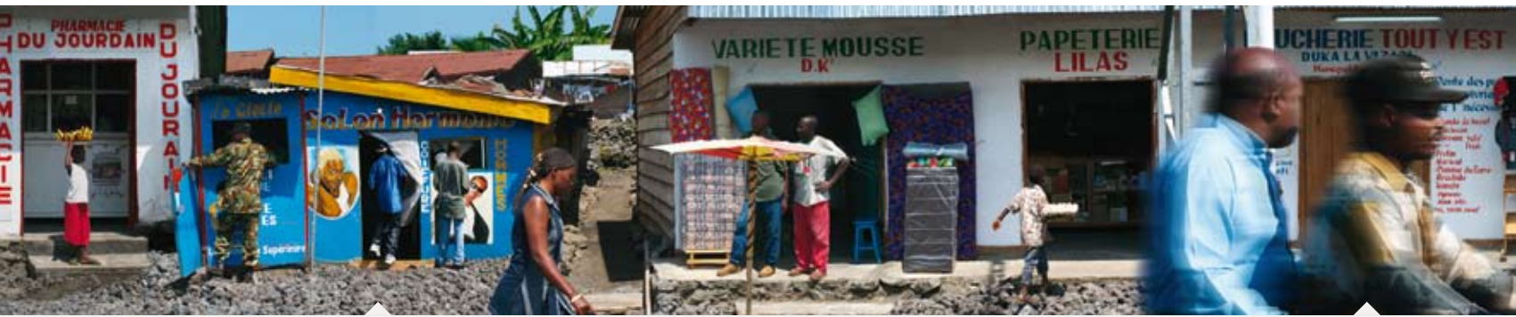
Mutone hat seit zwei Jahren ein Coiffure-Geschäft. Pro Haarschnitt verlangt er 1 Dollar. Er ist verheiratet und hat vier Kinder. Sein Traum ist, einmal nach Europa zu reisen.