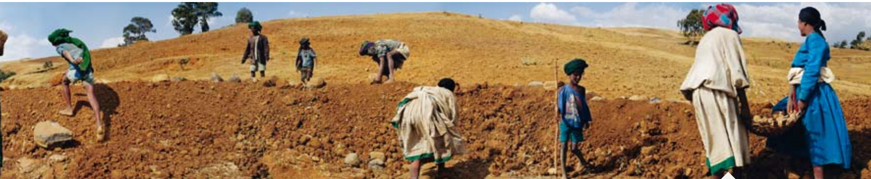
Finaddis ist 35 Jahre alt und hat drei Kinder. Wegen der knappen Nahrungsmittel will sie kein viertes.