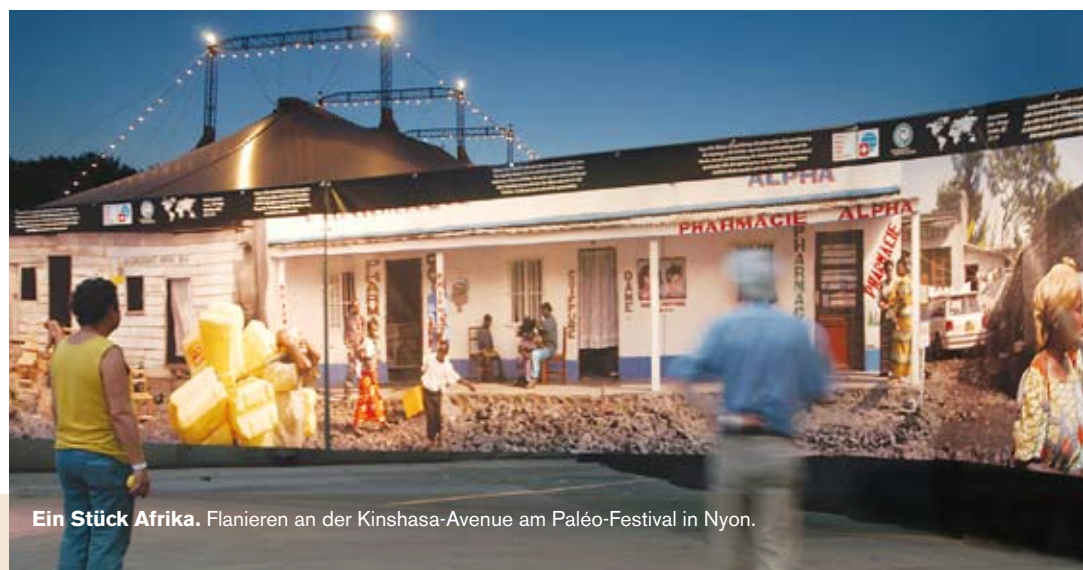
Ein Stück Afrika. Flanieren an der Kinshasa-Avenue am Paléo-Festival in Nyon.

Was passiert mit den riesigen Panoramabildern? Die Bilder werden an Festivals oder Kongressen ausgestellt. Am Paléo-Festival in Nyon wurde ein Bild in der Grösse 2,20×120