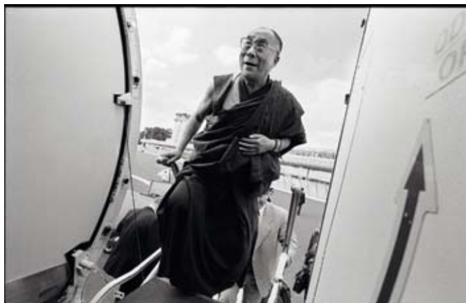
Unterwegs für den Frieden. Mit grossem Humor und einer heiteren Gelassenheit bereitet der Dalai Lama die ganze Welt und gibt seine Botschaft des Mitgefühls weiter.

Ich konnte vor Ort diese Zustände aber nicht fotografisch dokumentieren, da Chinesen Journalisten nicht frei arbeiten lassen. Die Tatsache, dass auch nach Jahrzehnten chinesischer Besetzung immer noch viele Tibeter ihr Leben riskieren, um aus ihrer Heimat zu flüchten, war für mich der Beweis, dass die Repression gross ist.