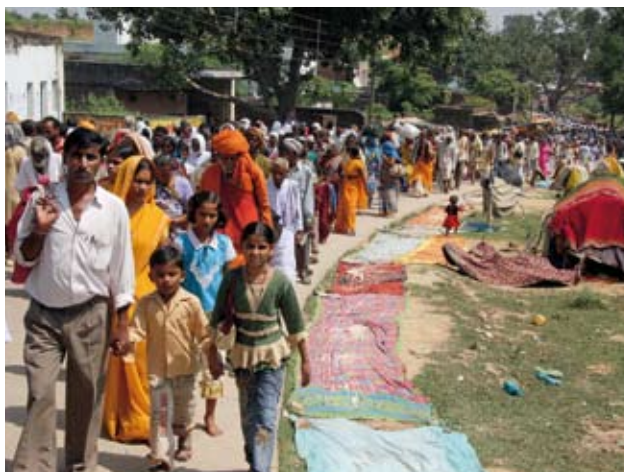
Grosses Pilgerfest. Die Menschen versammeln sich in Chitrakoot, und der unübersehbare Strom bewegt sich um den heiligen Berg (oben).

Ich fühle mich wohl in meinem Hochbett und staune, dass schon kurz nach der Abfahrt ein junger Mann in brauner Jacke durch den Wagen läuft, um Bestellungen für ein einfaches Nachtessen entgegenzunehmen. Die Linsen mit Reis und zwei Chapatis, die ich eine Stunde später esse, schmecken gut. Draussen ist es bereits dunkel, nur wenn der Zug eine Ortschaft passiert, tauchen Lichter auf. Ein offener indischer Eisenbahnwagen mit lauten Nachbarn, die bei den Zwischenstopps kommen und gehen, ist nicht gerade der Ort für eine erholsame Nacht. Und doch habe ich auf der schmalen Pritsche recht gut geschlafen, als mich am nächsten Morgen der Teeverkäufer mit lauten Chai-Rufen weckt. Kann es an einem solchen Morgen etwas Bes-