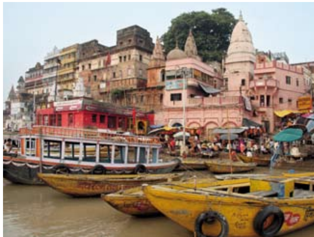
Velorikscha. Die ganze Familie inklusive Gepäck finden Platz (ganz oben).