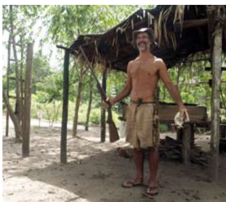
Wildnis und Naturparadies. Morgenstimmung über Amazonien (oben).