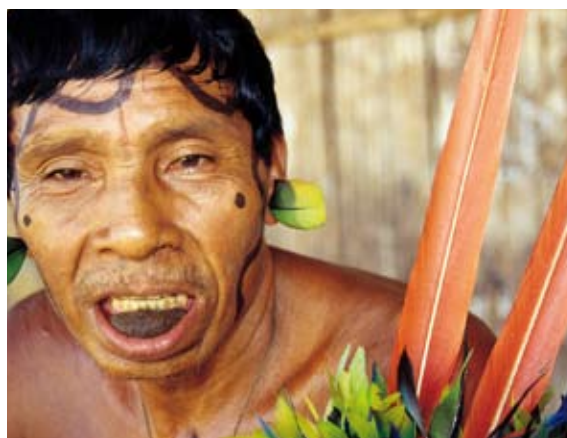
Vor 16 Jahren. Damals mit zwei Booten unterwegs (l. oben). Aussteiger. Bei Eberhard auf der ersten Reise (ganz oben). Goldsucher. Auf der Suche nach dem Glück (Mitte). Indianer. Bedroht von der Zivilisation (unten).

Amazonas. Wir waren fasziniert von einem selbstbestimmten Leben, wir verstanden, dass ein ruhiger Sonnenuntergang über dem Fluss und das ferne Geschrei der Brüllaffen erfüllender war als jede Quizsendung im Fernsehen. Der Amazonas hatte uns in seinen Bann gezogen. Wir wussten schon jetzt, dass wir wiederkommen würden.